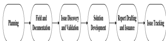
Gambar 2. Tahapan Penelitian Audit

Menurut (Schiller : 2011) proses audit sistem informasi dilakukan melalui tahapan-tahapan sebagai berikut :