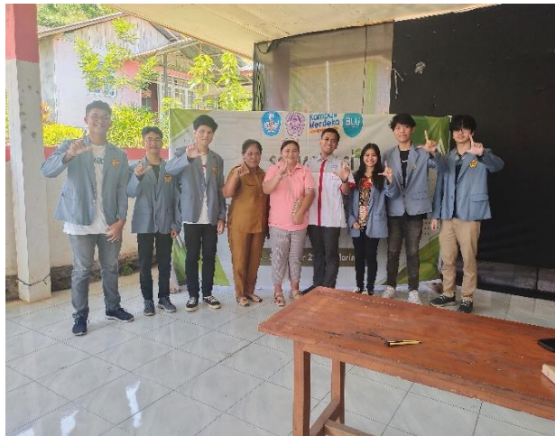
Gambar 7. Pertemuan dengan Masyarakat Desa Marinsow