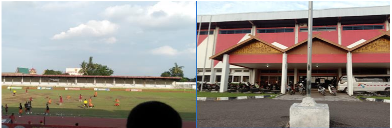
Gambar 1. Lapangan Tri Lomba Juang (Kompleks Perkantoran KONI Prov. Jambi)

KONI Provinsi Jambi merupakan satu-satunya organisasi yang berwenang dan bertanggung jawab mengelola, membina, mengembangkan & mengkoordinasikan seluruh pelaksanaan kegiatan olahraga prestasi di Provinsi Jambi. KONI Provinsi Jambi Memiliki Anggota 11 KONI Kabupaten/Kota yang menjadi tempat bernaung berbagai macam cabang olahraga prestasi serta ribuan atlet berprestasi.