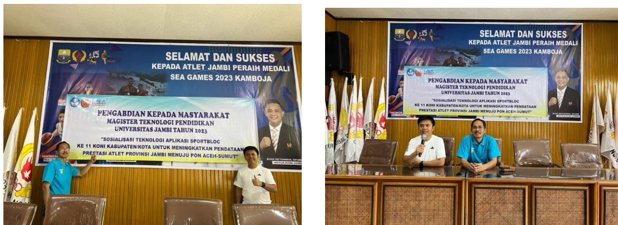
Gambar 3. Sosialisasi Pemanfaat teknologi aplikasi sportbloc

Universitas Jambi melalui program pascasarjana program studi Magister Teknologi Pendidikan selalu memberikan peluang bagi para dosen untuk terus terlibat aktif dalam memberikan manfaat keilmuan bagi masyarakat sesuai dengan keilmuan masing-masing khususnya bidang teknologi. Kewajiban mengabdikan kepada masyarakat merupakan kewajiban dosen melaksanakan Tri Darma Perguruan Tinggi. Setiap tahunnya Program Pascasarjana Universitas Jambi selalu mensupport serta memwadahi dosen untuk terus berpartisipasi pada program pengabdian dan selalu menawarkan topik-topik mutakhir pengabdian sesuai kebutuhan bidang keilmuan program studi magister teknologi pendidikan.