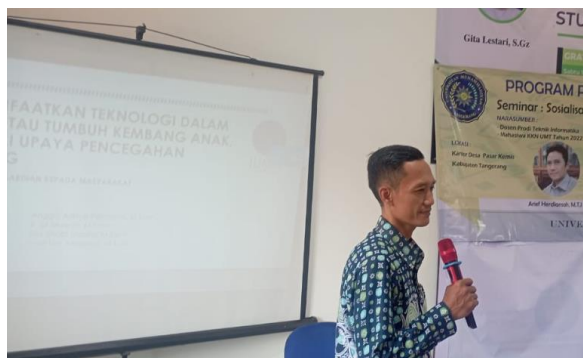
Gambar 2. Pengarahan kegiatan seminar & pelatihan penggunaan aplikasi peduli lindungi

Persiapan aktifitas pengabdian masyarakat dimulai dari proses persiapan acara seminar dan pelatihan yaitu dengan melakukan koordinasi dengan puskesmas setempat untuk dapat memberikan pendampingan kami sebagai nara sumber dalam seminar tentang pentingnya aplikasi Peduli Lindungi walaupun pandemic Covid-19. Kami juga melakukan pelatihan untuk tutor-tutor dari mahasiswa yang akan membantu proses pelatihan penggunaan aplikasi Peduli Lindungi mulai dari proses instalasi sampai dengan penyampaian semua fitur dan informasi yang dapat diperoleh dan digunakan oleh masyarakat pengguna aplikasi Peduli Lindungi.