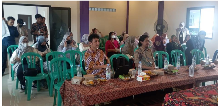
Gambar 4. Ibu-ibu Hasil Kerajinan Kalung Masker