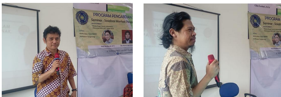
Gambar 3. Aktifitas penyampaian materi kegiatan seminar aplikasi peduli lindungi

Pada acara seminar ini, pemateri juga memberikan informasi fitur-fitur yang terdapat pada aplikasi Peduli Lindungi, dan bagaimana memanfaatkan fitur tersebut sehingga masyarakat dapat menerima manfaat yang sebesar-besarnya dari aplikasi Peduli Lindungi.