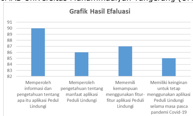
Gambar 6. Gambar grafik evaluasi peserta kegiatan ABDIMAS

Setelah acara seminar dan pelatihan aplikasi peduli lindungi berakhir, tahapan akhir dari kegiatan ABDIMAS ini adalah melakukan evaluasi kegiatan yang dilakukan dengan meminta para peserta mengisi angket yang berisi tanggapan peserta seminar dan pelatihan terkait manfaat yang didapat peserta berkaitan dengan pengetahuan tentang aplikasi peduli lindungi, mantaaf aplikasi peduli lindungi dan juga kemampuan peserta dalam menggunakan aplikasi peduli lindungi sebagaimana yan telah disampaikan dan diajarkam tim ABDIMAS Universitas Muhammadiyah Tangerang (UMT).