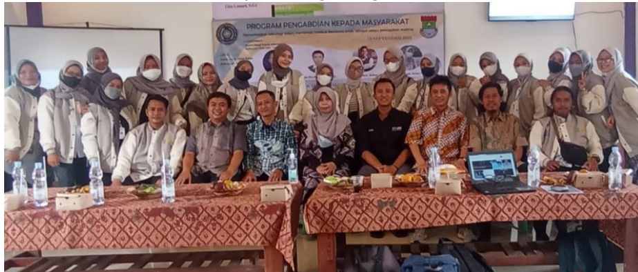
Gambar 5. Tim ABDIMAS dosen dan mahasiswa Universitas Muhammadiyah Tangerang

Setelah melakukan penyampaian materi berkaitan dengan aplikasi peduli lindungi, acara selanjutnya para peserta diminta untuk melakukan instalasi serta bersama-sama menggunakan aplikasi peduli lindungi didampingi oleh tutor yang merupakan dosen dan mahasiswa Universitas Muhammadiyah Tangerang..