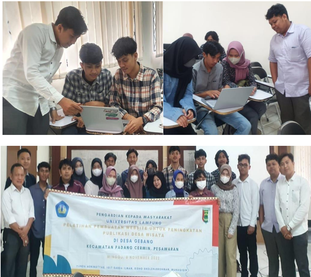
Gambar 3. Pelaksanaan kegiatan pelatihan.