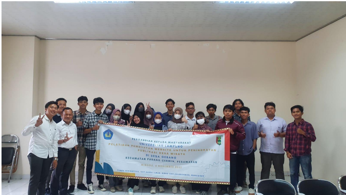
Gambar 1. Banner kegiatan pelatihan.

Modul pelatihan berisi penjelasan mengenai cara mendownload dan menginstall wordpress pada localhost. Berikut diberikan contoh modul pelatihan terlihat pada Gambar 2.