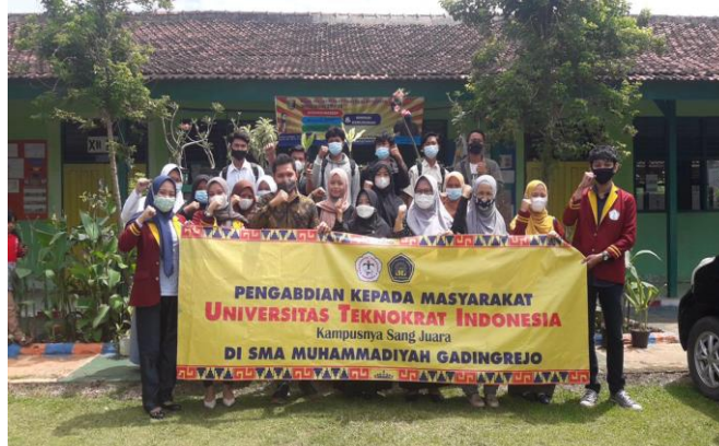
Gambar 2 Foto Bersama Tim dan Peserta Pengabdian Masyarakat

Menerapkan e-learning dengan menggunakan website di SMA Muhammadiyah Gading Rejo berjalan dengan baik karena beberapa keunggulan seperti: 1) website grammar sebagai media pembelajaran adalah hal baru bagi mereka sehingga para siswa/i lebih bersemangat dan termotivasi dalam belajar tata bahasa Inggris dasar, 2) komputer juga tersedia di lab sekolah dan siswa/i juga memiliki gadget sehingga website grammar mudah diakses untuk mereka, 3) tidak ada waktu batas akses website , 4) siswa/i juga dapat mandiri dalam belajar.