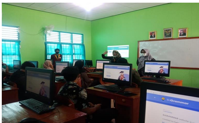
Gambar 3 Para Peserta Pelatihan Sedang Menggunakan Website Grammar di Lab Komputer

Para peserta dalam kegiatan pengabdian masyarakat yang dalam hal ini adalah para siswa/i menyadari bahwa website grammar ini sangat dibutuhkan sekali sebagai alternative media pembelajaran dimana mereka sangat bersemangat belajar tata bahasa Inggris dasar dengan menggunakan gadget . Hal ini yang semakin memotivasi siswa/i untuk mengakses materi belajar di luar jam sekolah. Penyampaian materi pelatihan dan langkah-langkah penggunaan website grammar yang disampaikan tim pelaksana juga dapat dipahami dengan baik dan mudah oleh peserta. Peserta pelatihan juga terlihat antusias pada saat sesi diskusi. Para siswa/i sangat detail mengikuti kegiatan pelatihan ini dan menyatakan bahwa apa yang mereka terima amat sangat jelas, bisa dipahami secara mudah sehingga mereka bisa mengimplementasikan penggunaan website grammar baik dengan cara dibimbing maupun melakukan praktek secara mandiri.