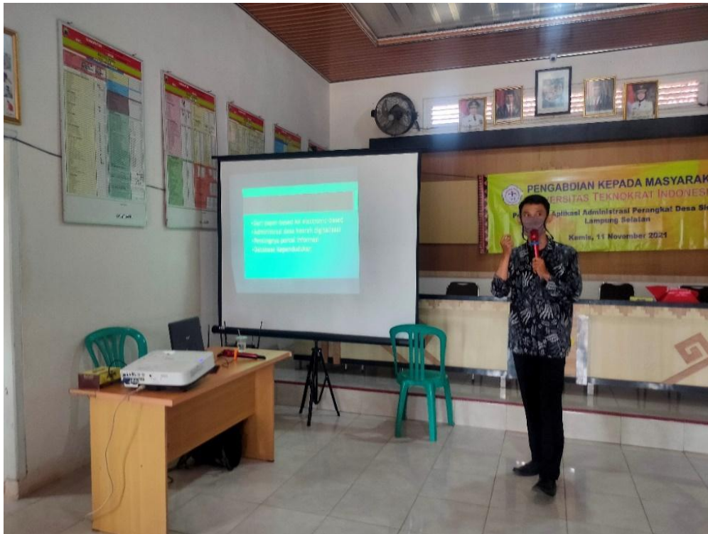
Gambar kegiatan 2 Penyampain materi web