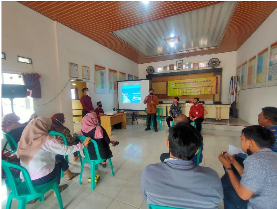
Gambar kegiatan 1, Sosialisasi mengenai administrasi desa