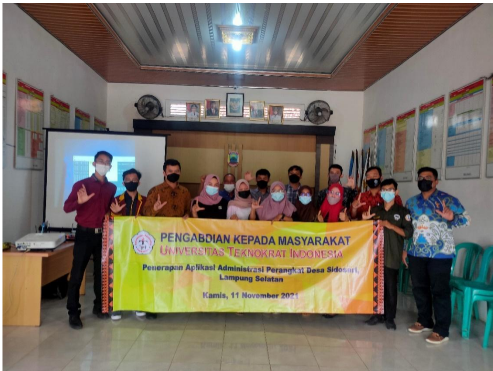
Gambar kegiatan 3 Foto bersama