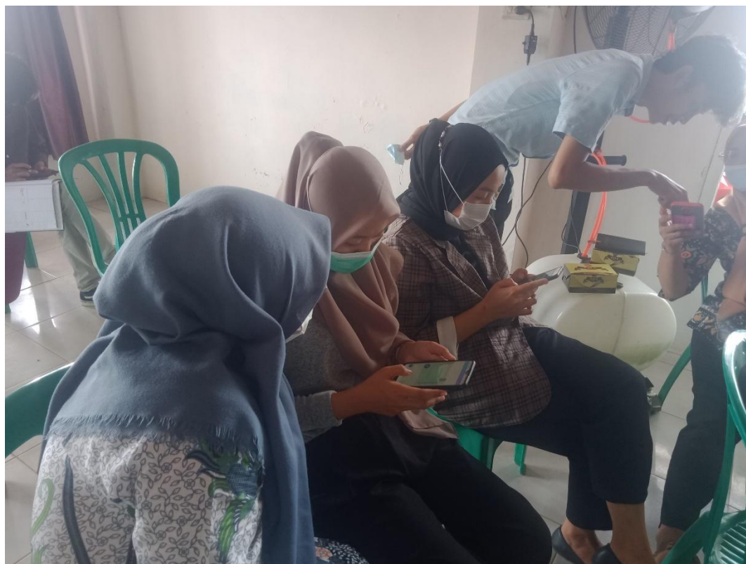
Gambar kegiatan 6, Praktek pembuat desain