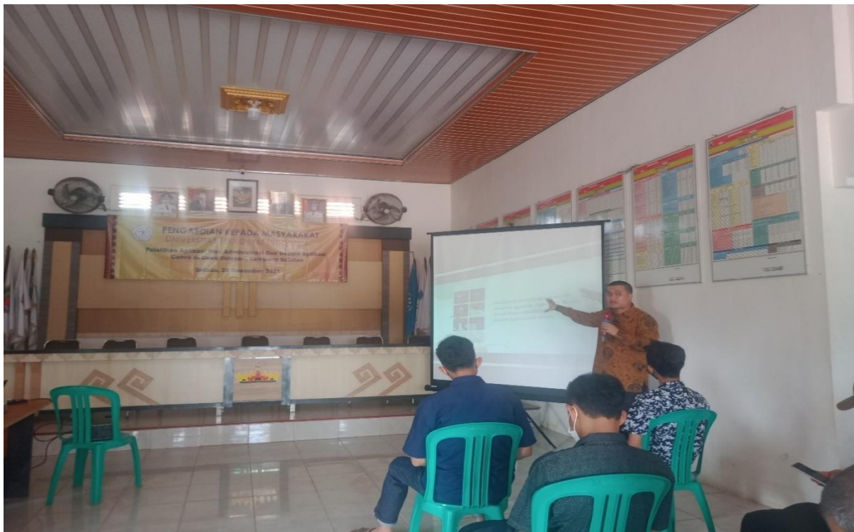
Gambar kegiatan 4, Pengenalan aplikasi canva