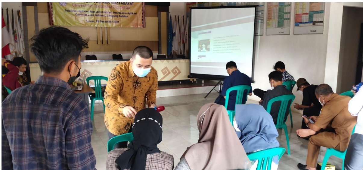
Gambar kegiatan 5, menyampaikan materi mengenai canva