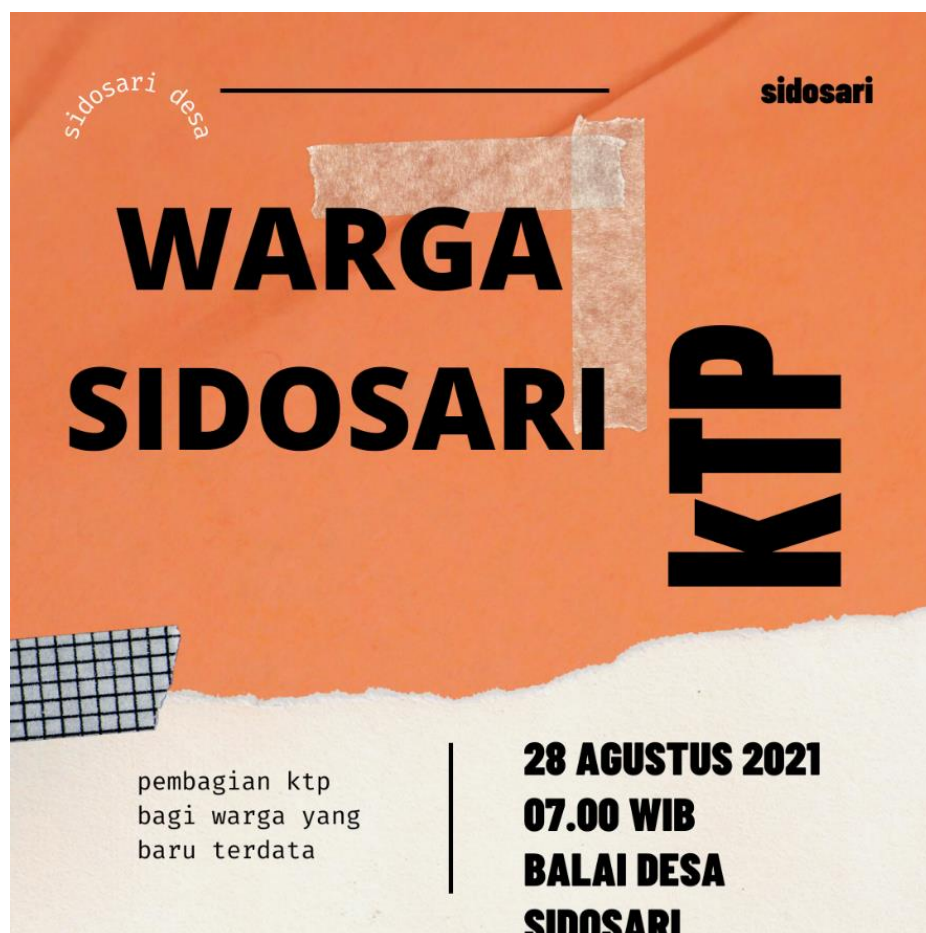
Gambar 1. hasil desain canva masyarakat desa sidosari

Dari sosialisasi program pengabdian kepada masyarakat, mendapatkan hasil, banyak masyarakat yang tertarik dengan desain Canva mengingat di desa mereka banyak yang mendirikan Umkm dan perangkat desa juga sangat tertarik dengan desain, khususnya untuk desain eksistensi pemerintah desa mereka. Berikut ini beberapa hasil desain masyarakat yang telah mereka buat.