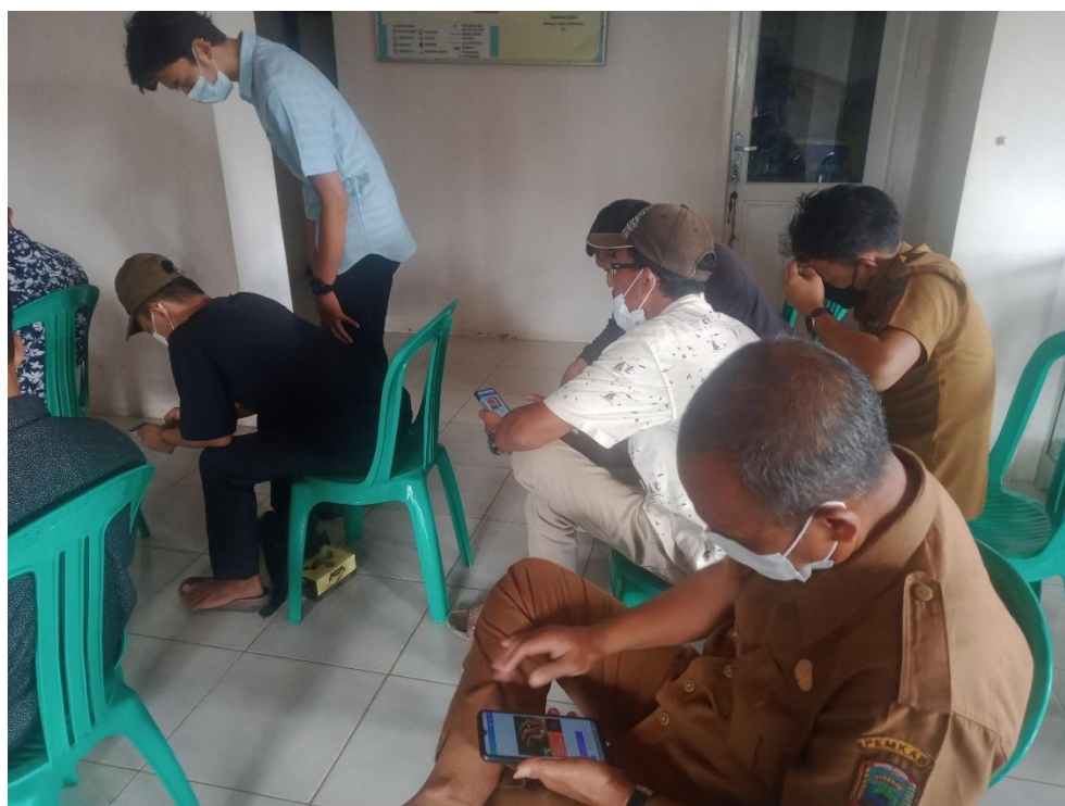
Gambar kegiatan 7, pembelajaran canva